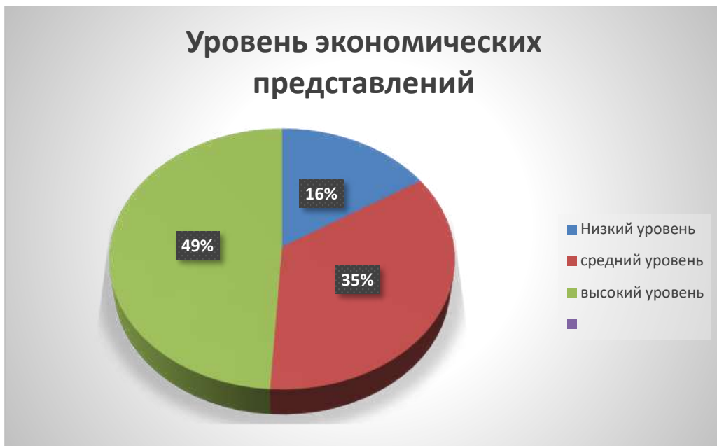
Рис 2. Результаты уровня сформированности экономических представлений у старших дошкольников группы «Радуга» после реализации проекта.

Итак, уровень сформированности экономических представлений детей группы «Радуга» с показателем «высокий» по результатам обучающих занятий составил 49%, с показателем «средний» – 35%, а с показателем «низкий» - 16%.